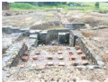
Li sâle di bagn (tchôdès aiwes)

Li boket li mî wârdé do bastimint, c' est, sins manke, les bagnes. Li plaeece po fé do feu est co câzu téle ké. Ådzeu, ene dale k' i s' fât mādjiner, po les djins fé leus ramouyaedjes. Avou del tchôde aiwe, ca gn a eto deus ôtes bassins, onk avou del froede aiwe, et onk avou del tiene. On vikéve bèn, savoz, a Mājhrœ, la 1800 ans.