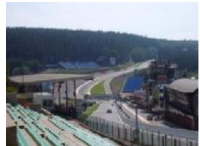
Li « gritchete » u « roedion »

« Sourd », èt çoula pou les quate preumîs. Pus lon dins l' coûsse, i gn a yeû saquants bias mouvments, èt çoula co pus rade grâce à miraculé d' Monrèyâl, Kubica, èyèt mâgré l' rèplaçmint d' ès moteûr. Après s' sôrtiye di route a Monza, Kimi Raikonen a gâgnî pou l' trwèsième côp a Francortchamps, padvant s' n equipî Felipe Massa. Il avouwe ètou qu' c' est s' circwit préfère. Les Mac Laren d' Alonso èt di Hamilton ont fini djusse après.