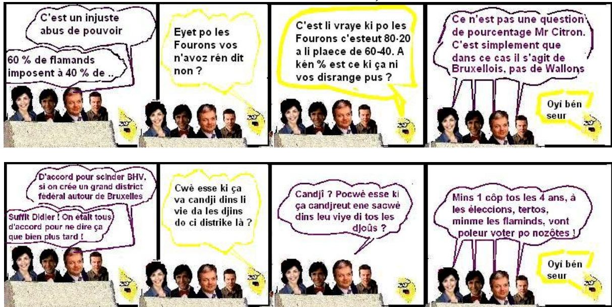
Cial âdzeu : montaedjes da Baudoux Francis, do Vî Djnape ; âdzo : dessinaedje da Samuel Lemaire, di Brâ-dlé-Librâmont ; Kattenbroekstraat, 217, 1700 Dilbeek