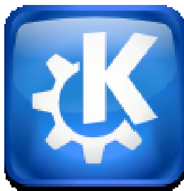
Imâdjete do scribanne KDE

Mins nerén, dins Linux, ons a l' tchoes inte sacwants : KDE, Gnome, Xfce... Les deus prumîs ont stî ratournés e walon.