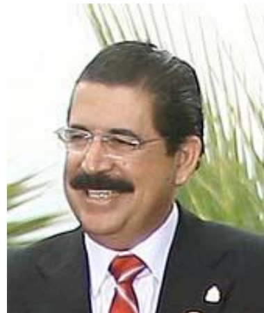
Manuel Zelaya e 2007

Li sâme des poutchisses, c' esteut di n' nén fé trop d' brut. Insi, il ont Bén prins asteme di n' nén touwer trop di djins, po-z esse sotnous des medias occidentâs. Come d' efet, i gn a ki l' TeleSUR, li televuzion publike latinamerikinne, k' a dit l' vrayi do côp. Ses gaztîs ont riské leu veye po çoula. Tantea ki CNN et ls ôtes ont stî oblidyîs d' endè câzer avou.