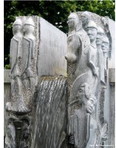
Fontinne d' Oû-l'-Grand [Orp-le-Grand] avou les cwate fis Aimon.

Dins les bwès, les cwate frés su nourixhèt du tchâ tote crowe et boere l' aiwe des rixheas. C' esteut co pus deur di l' ivier.