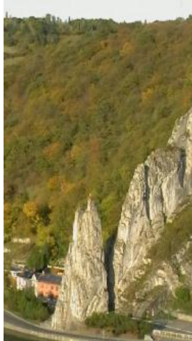
Li Rotchî Bayåd, a Dinant

s' elaxhèt, ki poite lu no d' âbe des cwate fis Aimon.