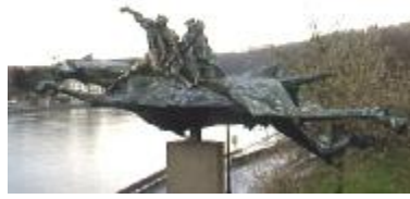
Posteure do tchvâ Bayâd a Nameur

On creye « âs âres ! » et les djonnes fideles a l' Impreur atakèt les cwate frés Aimon ki duwelèt e rescoulant do costé dol sôrteye. Fels duwelisses, les cate frés è touwèt mwintes. Runâd shofele et Bayârd, si tchvâ, arive âs pîs des montêyes du l' intrêye. Les frés hoplèt tos les cwate so lu tchvâ ki pete â diâle et co pus lon. Haydaday so l' grand bwès d' Ârdene. Il ont avou zels troes scalots ki saetchèt leus ôtes tchuvâs.