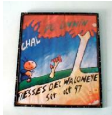
Afitchè UCW-Institut Destrèe po les Fiesses del Walonreye 1997 ; tecse e rfondou da L. Hendschel

burton, eyet "Yannick Bauthière", li waloneu djiblotin. Ci-ci ourit l' crâne idêye d' enonder l' pordjet sol djâspinreye "Berdelaedjes". Do côp, i rascoda on fel côp di spale d' ene pwaire di "Berdelisses". Shijh moes pus târd, l' efant vneut à monde : on ptit motî d' potche avou ene sacwè come 4000 mots do walon à francès, ey ostant do francès à walon. Vos l' ploz trover dins vosse livreye po nén co 10 €.